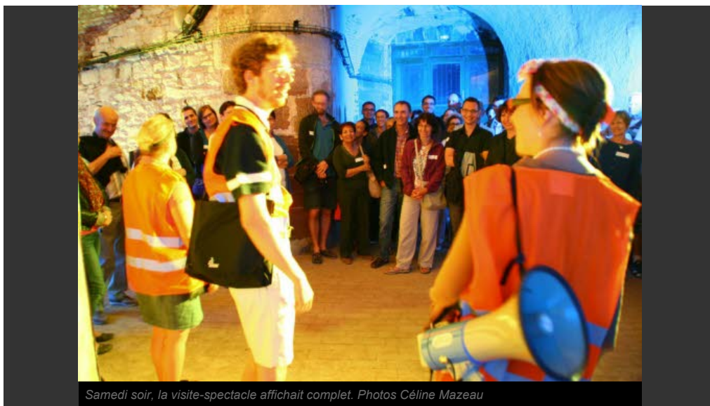
Samedi soir, la visite-spectacle affichait complet.